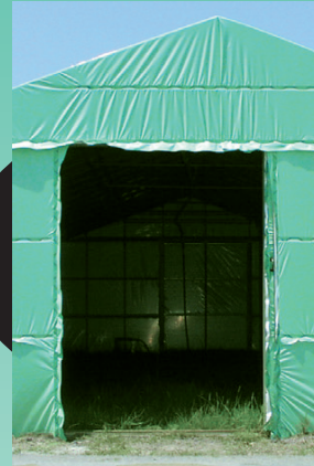
内側「白色」 外側「緑色」